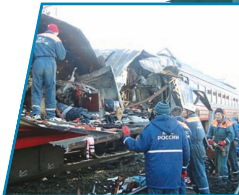
Подорвана электричка на участке Кисловодск — Минеральные Воды. 5 декабря 2003 г.

ядерного оружия, сложно, но вполне возможно. Многие террористические организации имеют большие финансовые ресурсы и связаны со спецслужбами различных стран. На современном этапе это явление превратилось в фактор, серьёзно дестабилизирующий нормальное развитие международных отношений. Особую опасность могут представлять террористические посягательства с использованием ядерных и иных средств массового поражения.