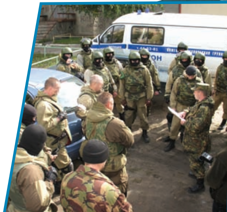
Подразделению спецназа ставят задачи перед выходом на операцию.

В 2008 году в качестве приоритетной для Национального антитеррористического комитета (НАК) являлась задача по снижению террористической угрозы в стране и предотвращению преступлений террористической направленности.