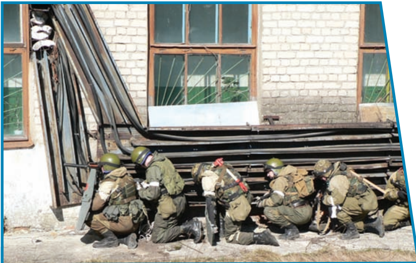
Бойцы спецназа перед штурмом здания, захваченного террористами.

Контртеррористическая операция проводится для пресечения террористического акта, если его пресечение иными силами или способами невозможно. Все военнослужащие, сотрудники и специалисты, привлекаемые для проведения контртеррористической операции, с момента начала операции и до её окончания подчиняются руководителю контртеррористической операции.