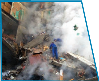
Жилой дом, взорванный террористами. Москва, улица Гурьянова, 1999 г.

ющей в данный момент в стране политической власти.