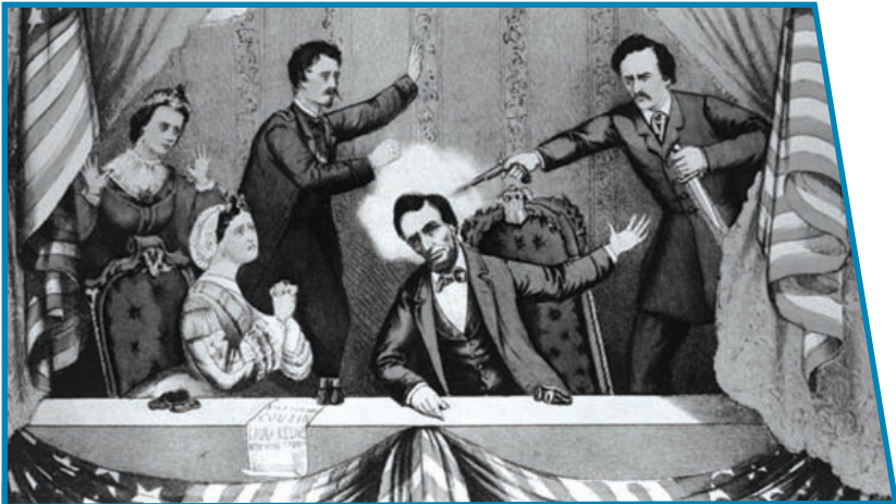
Убийство президента США А. Линкольна в театре. 1865 г.

профессией для радикально настроенных кругов — революционеров и националистов. Тогда же были выработаны основные формы и методы террористической деятельности, сформировались образцы стратегии и тактики террористов.