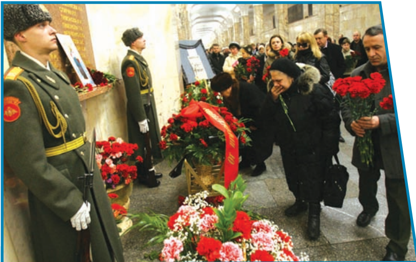
Акция памяти жертв теракта на станции «Автозаводская» Москвы.

ность за теракт. Видеокассета с записью его заявления была показана арабской телекомпанией «Аль-Джазира» в первую годовщину трагических событий.