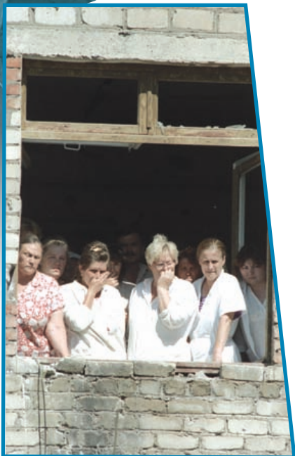
Заложники городской больницы г. Будённовска. 1995 г.

Пример: многолетняя деятельность Ирландской республиканской армии, целью которой являлось отколоть Северную Ирландию от Великобритании.