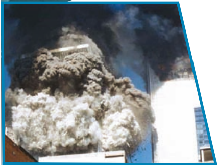
Взрыв Всемирного торгового центра. 11 сентября 2001 г.

международной антитеррористической коалиции, объявление терроризма главной опасностью для мировой цивилизации и возведение задачи уничтожения терроризма в ранг первоочередных проблем мирового сообщества.