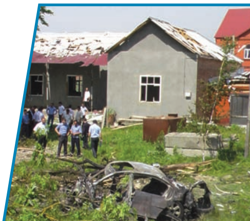
Покушение на президента Республики Ингушетии Ю.-Б. Евкурова. 2009 г.

Террористы хотят добиться решения своих преступных замыслов, посеять страх, запугать государственные органы,