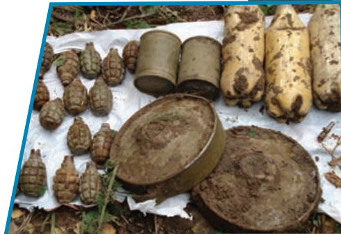
Ликвидирован бандитский тайник с боеприпасами.

Летом 2008 года была пресечена попытка местных террористов и эмиссара «Аль-Каиды» организовать теракты в городах Сочи и Анапа с применением мощных взрывных устройств. К ответственности было привлечено 198 боевиков.