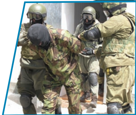
Террорист, удерживавший заложников, обезврежен бойцами спецназа.

Подразделения и воинские части Вооружённых Сил Российской Федерации привлекаются для участия в проведении контртеррористической операции по решению руководителя контртеррористической операции в порядке, определяемом нормативными правовыми актами Российской Федерации.