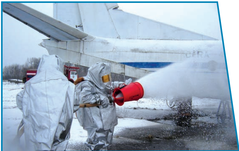
Бойцы войск гражданской обороны на тушении пожара.

Проведён комплекс долгосрочных мероприятий по противодействию идеологии терроризма.