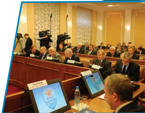
На заседаниях Национального антитеррористического комитета разрабатываются меры по противодействию терроризму.

Для организации планирования применения сил и средств федеральных органов исполнительной власти и их территориальных органов по борьбе с терроризмом, а также для управления контртеррористическими операциями в составе НАК образуется Федеральный оперативный штаб, а для управления контртеррористическими операциями в субъектах Российской Федерации — оперативные штабы, которые возглавляют руководители территориальных органов безопасности в субъектах Российской Федерации.