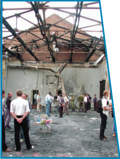
Руины школы №1 в г. Беслане.

ков под руководством арабского наёмника Хаттаба. Этот бой навсегда стал символом доблести российского солдата. Боевики пробились из Аргунского ущелья в Дагестан, чтобы убивать простых людей и жечь всё на своём пути, а потом взять сотни заложников и выдвинуть политические требования. Сколько бед принесли бы в Дагестан эти озверевшие, загнанные в угол 2 тысячи бандитов, страшно даже представить. Но на их пути встали 90 бойцов парашютно-десантной роты, которая заняла оборону на господствующей высоте. Десантники выдержали несколько атак. На рассвете 1 марта после миномётного обстрела бандиты со всех сторон